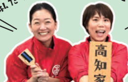
高知県移住コンシェルジュ

移住を考えるきっかけや目的はさまざま。 働き方の多様化が進み、より自由な生き方が選択できるよう なった今、好きな場所での暮らしを考えてみませんか?